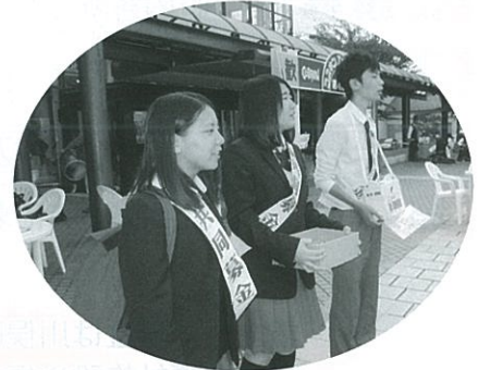
赤い羽根街頭募金運動（川俣高校）