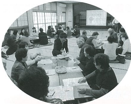
ふれあい・いきいきサロン交流会