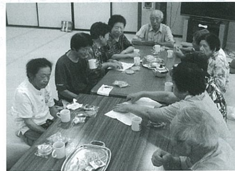
ふれあい・いきいきサロン