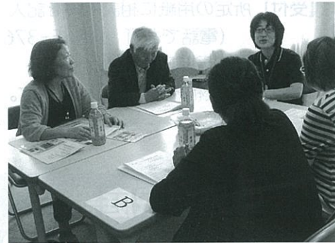
ボランティアと福祉施設職員の意見交換会