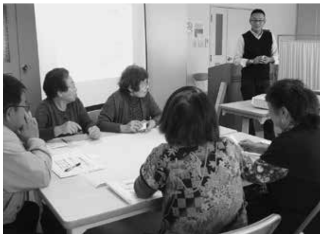
傾聴ボランティア講座