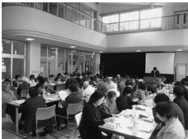
ふれあい相談員研修