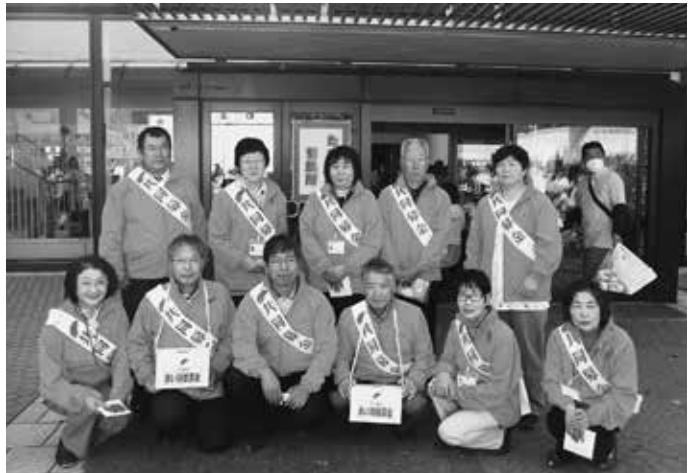
赤い羽根共同募金運動（街頭募金）