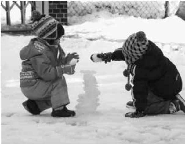
すみよし保育園のすこやかな保育活動