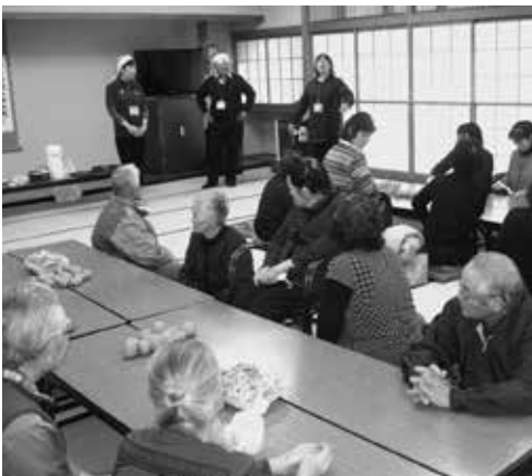
避難者サロンの開催 (山木屋・浪江合同クリスマス会)