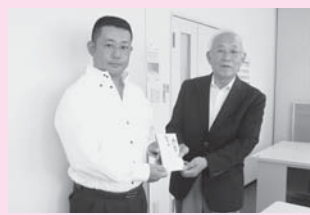
△ 川俣ロータリークラブ様