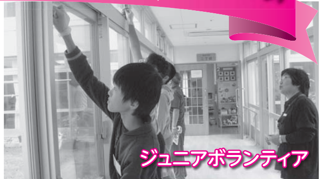
ジュニアボランティア

■ ボランティア活動の普及啓発、高齢者の生きがい支援、地域の防災事業、被災者支援、 町内の要援護世帯への支援（歳末たすけあい見舞金贈呈事業）など