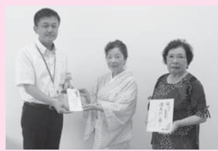
△ 藤華新流 澄美れ会様