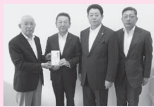
△ 川俣町建設同業会様