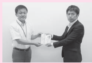
△ 川俣地区労働福祉協議会様