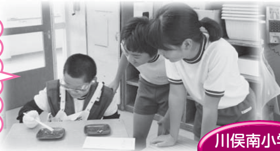
川俣南小学校 6年生