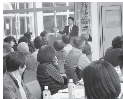
ふれあい相談員研修会