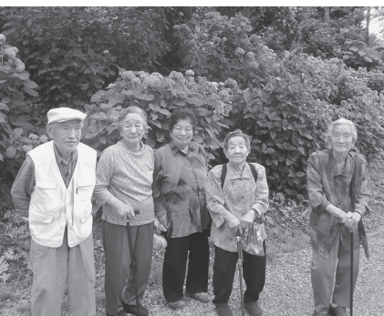
生きがいデイサービス