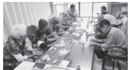
H31年度Jrボランティア