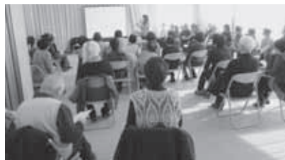
H31年度サロン交流会