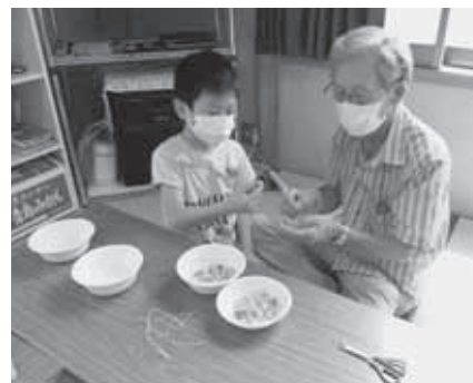
「数珠作り」 砂田集会所