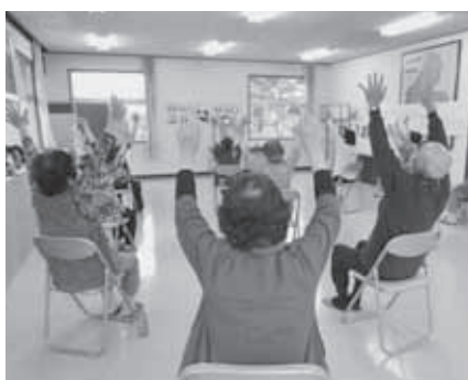
「笑いヨガ」 大綱木公民館