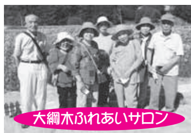
大綱木ふれあいサロン