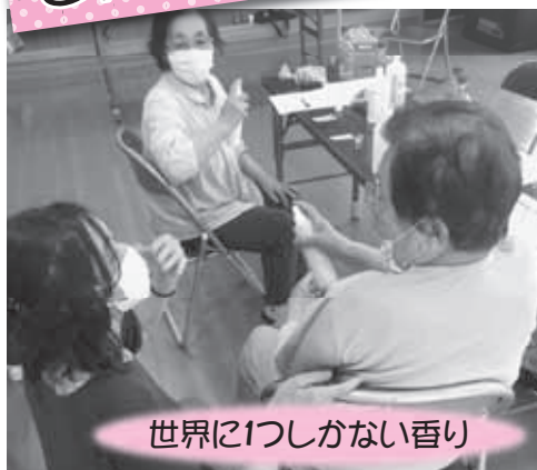
世界に1つしかない香り