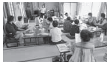
R2年ふれあい・いきいきサロンの活動支援

皆さんからご協力いただいた募金の約6割は川俣町の地域福祉活動に役立てられています。 (残り約4割は、全国の福祉活動などで活用されています。)