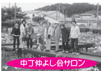
中丁仲よし会サロン