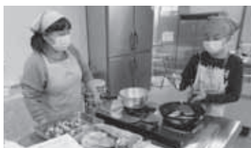
R2年度親子料理教室