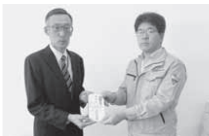
株式会社長谷川工務所 様