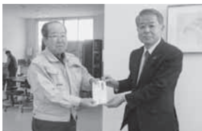
特定非営利活動法人 達南精神保健福祉会 様

町内の下記授産施設へ、歳末期に役立てていただくため20,000円の助成金を贈呈しました。