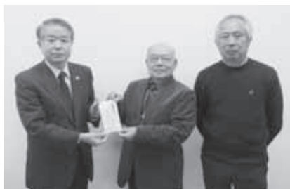
川俣精機OB精翔会 様