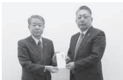
川俣ライオンズクラブ 様