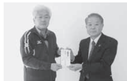
特定非営利活動法人 絆 様