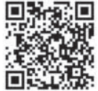
川俣町共同募金委員会QRコード

中央共同募金会の「赤い羽根インターネット寄付システム」を利用することで、コンビニ決済やクレジット決済による寄付ができます。右記QRコードから、川俣町共同募金委員会を指定すると寄付の申し込みができます。ご協力お願い致します。