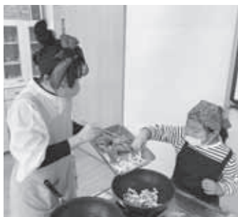
令和4年度 親子料理教室