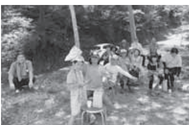
湧き水でのお茶会