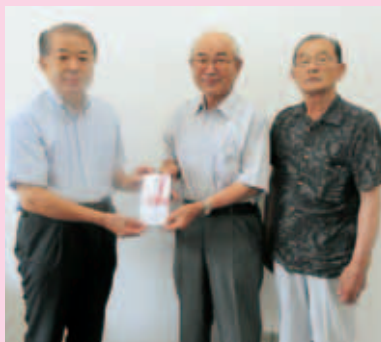
△ 山木屋いきいきサロン様