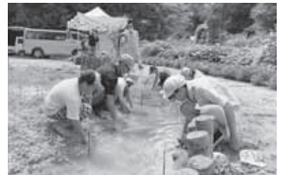
ホテルの小川整備