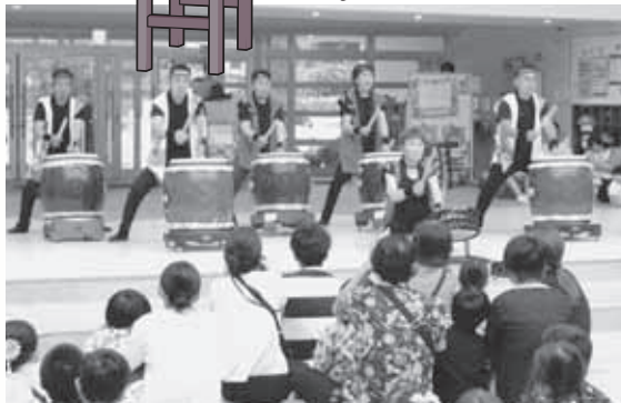
園児と子育て支援センターの利用者が楽しみました。