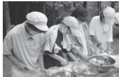
炊出し訓練 (カレー作り)