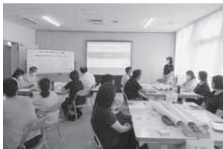
令和4年度 災害ボランティア講座