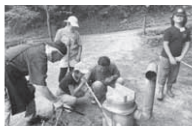
炊出し訓練 (窯での米炊き)