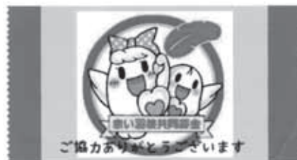
ジュニアボランティア講座生がデザインした「ありがとう飴」