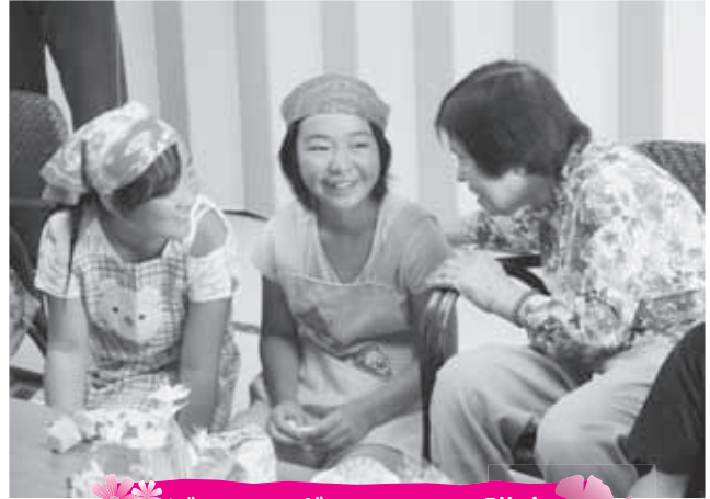
ジュニアボランティア講座