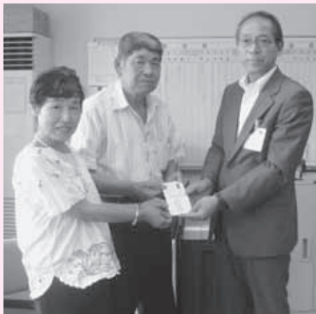
△ 東福沢・山木屋広域交流絆会様