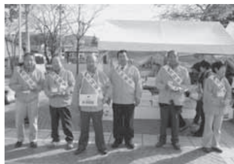
民生委員による街頭募金