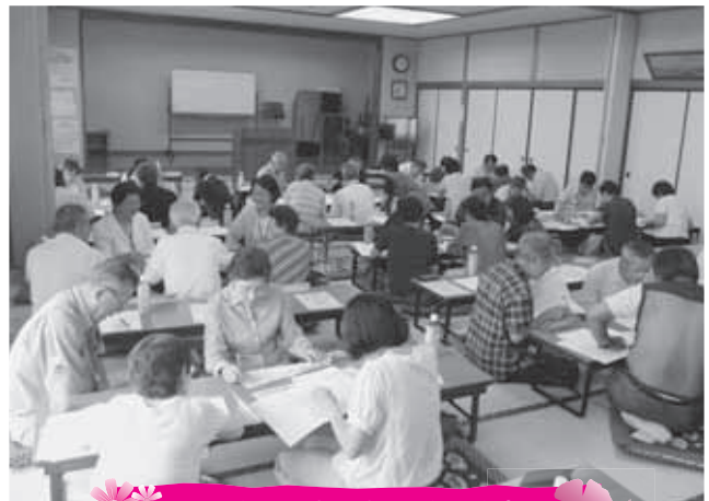
民生児童委員定例会