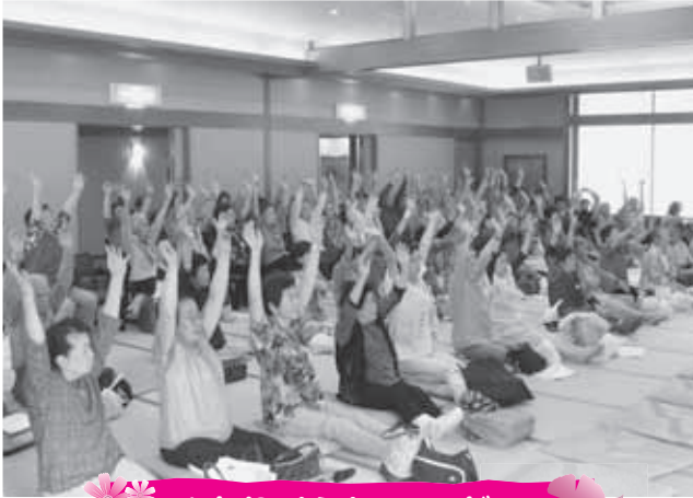
ひとりぐらしのつどい