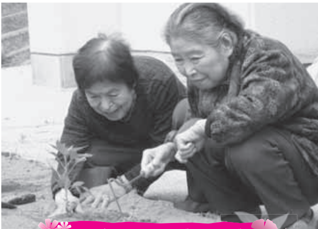
生きがい活動支援デイサービス