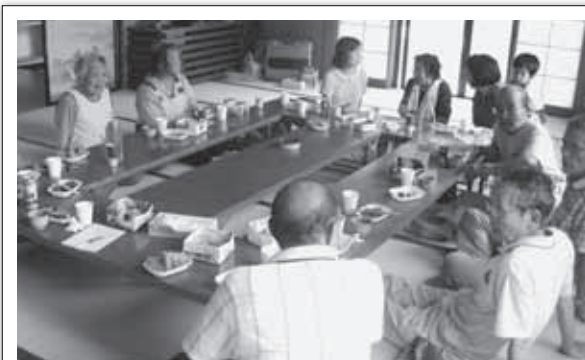
サロンへの助成金支給