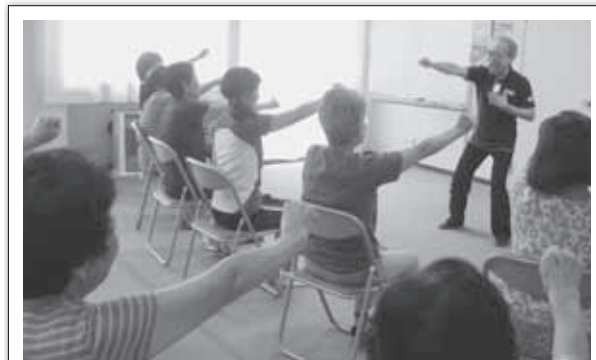
各種ボランティア講座の開催