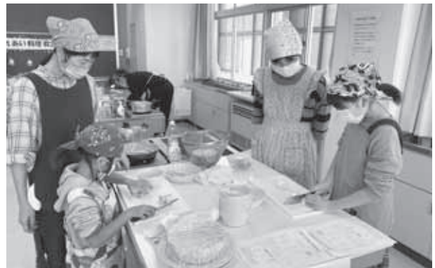
親子ふれあい料理教室 令和5年12月9日