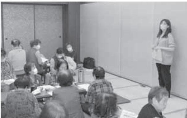
高齢者のつどい 令和5年10月4日