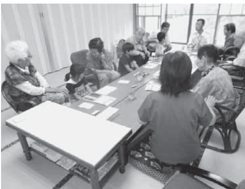
川俣ジュニアボランティア講座