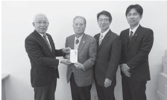
川俣町ライオンズクラブ 様