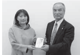
飯館村社会福祉協議会様