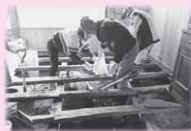
町内で飲食店を営むご夫婦