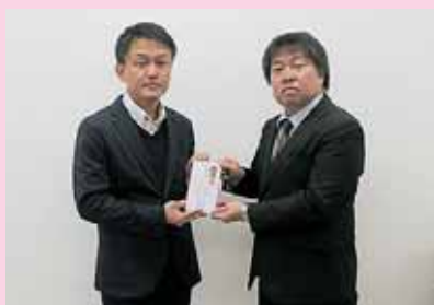
▷ ヤクルト親交会様