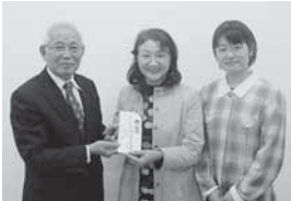
コミュニティーちゃばたけ様