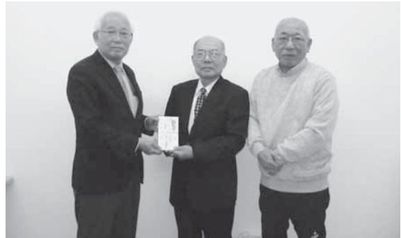
川俣精機OB精翔会 様