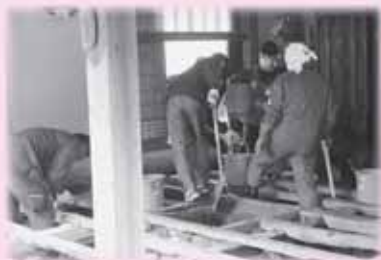
県外のボランティアさん