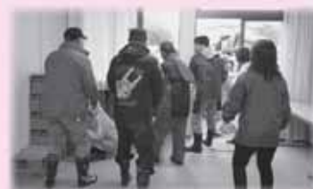
川俣ライオンズクラブ・聚溪會