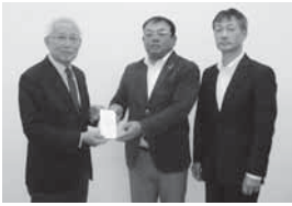
川俣ロータリークラブ様