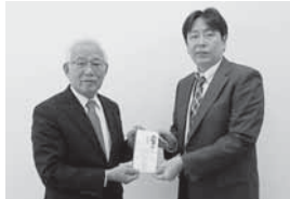
富士ゼロックス福島株数倶楽部様