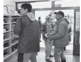
川俣ライオンズクラブ様・聚溪會様