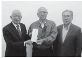
絹市実行委員会様