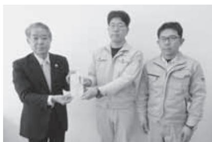
株式会社長谷川工務所 様