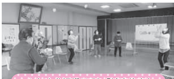
さわやか福沢サロン「健康教室」