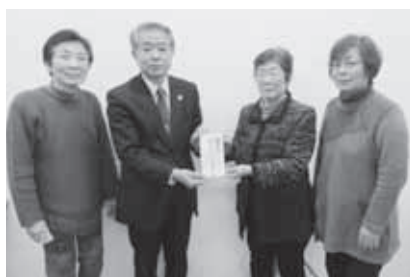
川俣町連合婦人会 様