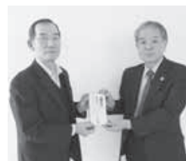
特定非営利活動法人 絆 様

歳末たすけあい事業を実施するにあたり、皆様からの善意の外、台湾共同募金会から「台湾友好基金」の助成を受け実施しております。