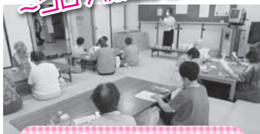
健康料理サロン「アロマづくり」