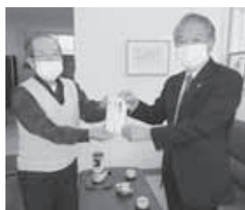
特定非営利活動法人 達南精神保健福祉会 様

町内の下記授産施設へ、歳末期に役立てていただくため各20,000円の助成金を贈呈しました。