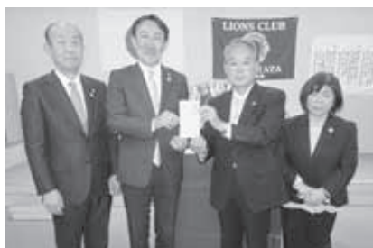
川俣ライオンズクラブ 様