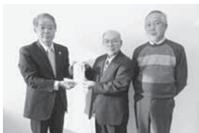
川俣精機OB精翔会 様