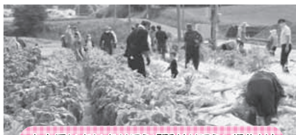
山木屋いきいきサロン「野外サロン・畑作り」