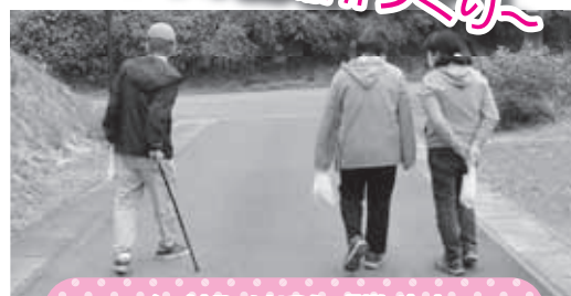
仁井町サロン「散歩」